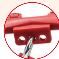
Diámetro del agujero: 8 mm

C.C. Bellota - Av. Guillero Dansey 510 Tienda Z1-4 Cercado de Lima Cel: 998 304 579 - 984 258 767 - 998 165 307 - 987 944 587