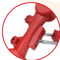
Cuerpo Plástico ABS