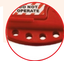
Espacio para 4 Candados

C.C. Bellota - Av. Guillero Dansey 510 Tienda Z1-4 Cercado de Lima Cel: 998 304 579 - 984 258 767 - 998 165 307 - 987 944 587