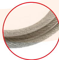
Cable de Acero