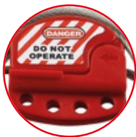
Cuerpo de Plástico ABS